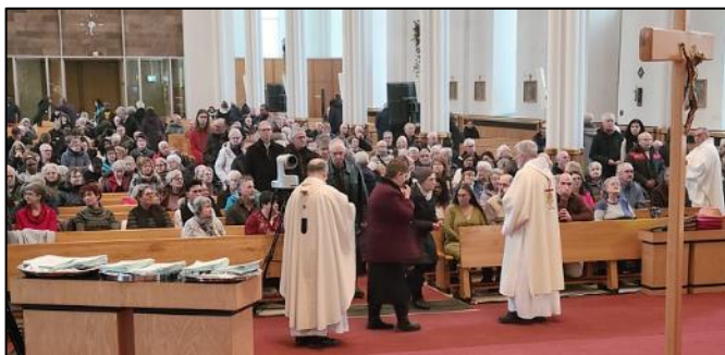
Un grand nombre de fidèles laïcs

La célébration a débuté par le rassemblement d'un groupe de « pèlerins d'espérance », à la salle paroissiale adjacente à la cathédrale, pour l'ouverture officielle de l'année jubilaire 2025. S'y retrouvèrent une centaine de laïcs, de prêtres et de diacres permanents. Cette partie de la célébration était rediffusée sur des écrans dans la nef de la cathédrale pour l'ensemble des fidèles demeurés dans l'église. Elle fut suivie par une procession des pèlerins vers l'arrière de l'église où Mgr Grondin a procédé à la bénédiction d'une eau rappelant le baptême. Par la suite, il en a aspergé les fidèles en circulant dans l'allée centrale. Puis chacun a repris sa place dans la nef et le cortège des concélébrants a regagné le chœur pour la célébration de l'Eucharistie.