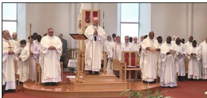
Plusieurs concélébrants et diacres permanents.