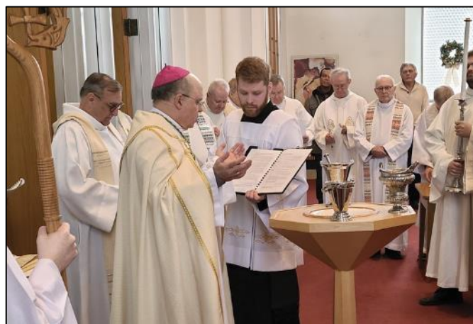
Bénédiction de l'eau baptismale pour l'aspersion qui va suivre.