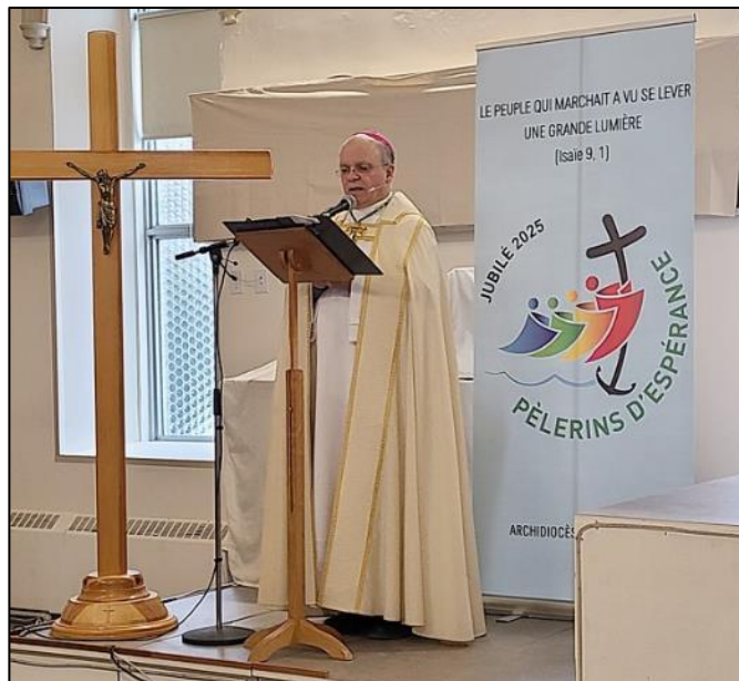
Mgr Denis Grondin ouvrant le Jubilé 2025.

La célébration a débuté par le rassemblement d'un groupe de « pèlerins d'espérance », à la salle paroissiale adjacente à la cathédrale, pour l'ouverture officielle de l'année jubilaire 2025. S'y retrouvèrent une centaine de laïcs, de prêtres et de diacres permanents. Cette partie de la célébration était rediffusée sur des écrans dans la nef de la cathédrale pour l'ensemble des fidèles demeurés dans l'église. Elle fut suivie par une procession des pèlerins vers l'arrière de l'église où Mgr Grondin a procédé à la bénédiction d'une eau rappelant le baptême. Par la suite, il en a aspergé les fidèles en circulant dans l'allée centrale. Puis chacun a repris sa place dans la nef et le cortège des concélébrants a regagné le chœur pour la célébration de l'Eucharistie.