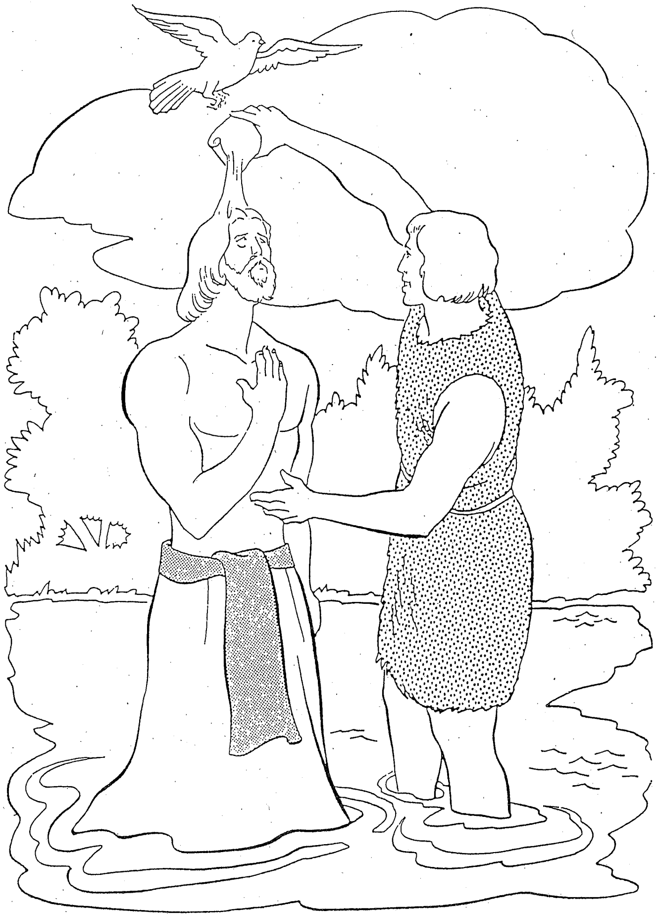
Jésus est baptisé par Jean-Baptiste et l'esprit de Dieu descend sur lui sous la forme d'une colombe.