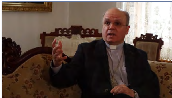
M gr l'Archevêque dans une entrevue enregistrée le 29 mars.

Quelques jours plus tard, dans Le Relais , édition du 15 avril, M gr l'Archevêque revient sur le contenu de cette entrevue. Il remercie M. Tremblay pour l'enregistrement réalisé à l'Archevêché dans un contexte apprécié, ouvert et détendu .