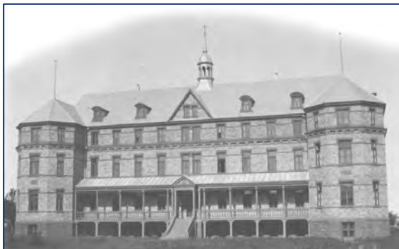
L'archevêché, nouvelle résidence épiscopale, en 1903.