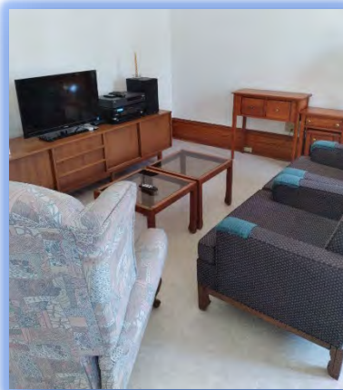
Un grand salon