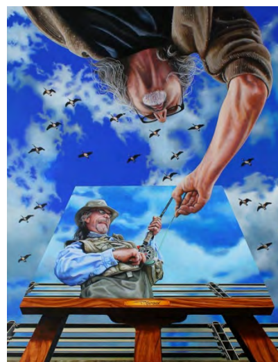
tableau « Autoportrait d'un peintre pêcheur » de la Camelback Gallery, une galerie d'art visuelle américaine qui expose des artistes de partout sur la planète. Le tableau de l'artiste matanaïse marie ses deux passions, la pêche et la peinture.