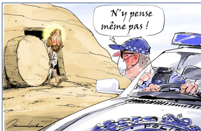
Johannes Leak, The Australian , 10 avril 2020 (traduit)