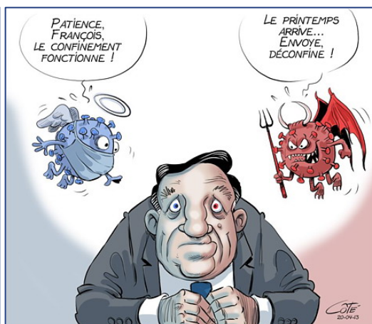
André-Philippe Côté, Le Soleil , 11 avril 2020