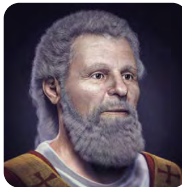
Saint Valentin d'après une reconstruction faciale

Quelle est l'origine de la Saint-Valentin, considérée comme la fête des amoureux ? Il est vrai que le 14 février ne correspond à aucune fête dans la religion romaine et n'a pas d'origine antique. L'origine réelle est attestée au XI e siècle dans la Grande-Bretagne, encore catholique à l'époque. La croyance populaire disait que les oiseaux débutaient la période d'accouplement le 14 février. En littérature, on retrouve ce rapprochement avec les amoureux dans les poèmes d'Othon de Grandson et de son contemporain, Charles d'Orléans, (1394-1465) qui font allusion à la Saint-Valentin comme le jour où