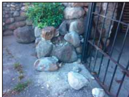
La Grotte de Notre-Dame-de-Lourdes Danger d'effondrement déjà commencé

Cet assemblage de photos vous transmet des informations visuelles concernant quatre « avaries » qui nous inquiètent. Vous pouvez aider.