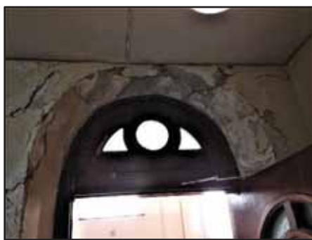
Les corridors latéraux se détériorent