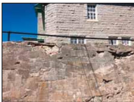
Il y a des réparations à y apporter